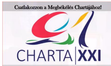
A Charta XXI mozgalom logója

Surján László, a mozgalom megálmodója, maga is külhoni gyökerekkel rendelkezik: Kolozsváron született, eredeti foglalkozása szerint orvos. Részt vett a rendszerváltást előkészítő ellenzéki mozgalomban, majd politikus lett, a Kereszténydemokrata Néppárt egyik alapítója és elnöke, parlamenti képviselő, később az Európai Parlament tagja és egyik alelnöke volt.