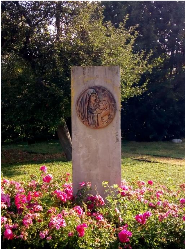
Kozárdi Madonna