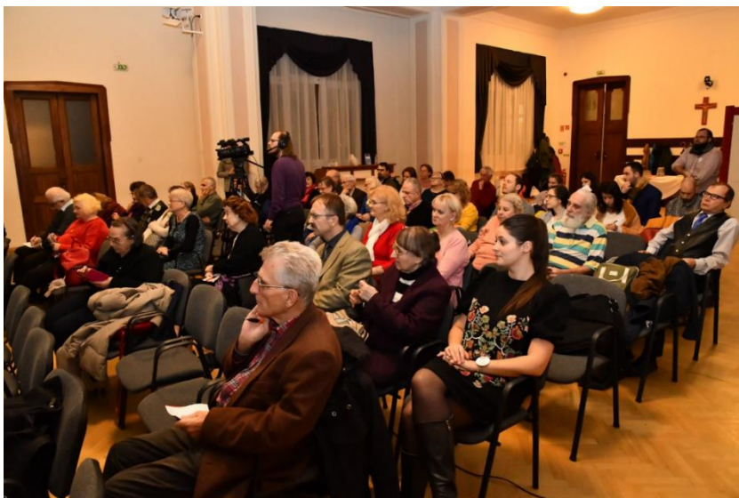
Jean Monnet-est a Párbeszéd Házában

A mozgalomnak igen aktív Facebook-oldala és YouTube-csatornája is van, ahol visszanezethetők az elmúlt évtized eseményei. Havonta tart rendezvényeket a mozgalom szellemiségéhez közel álló témákban a jezsuiták által vezetett Párbeszéd Házában (Budapest, VIII. ker. Horánszky u. 20.).