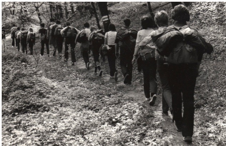
1973. május 1.