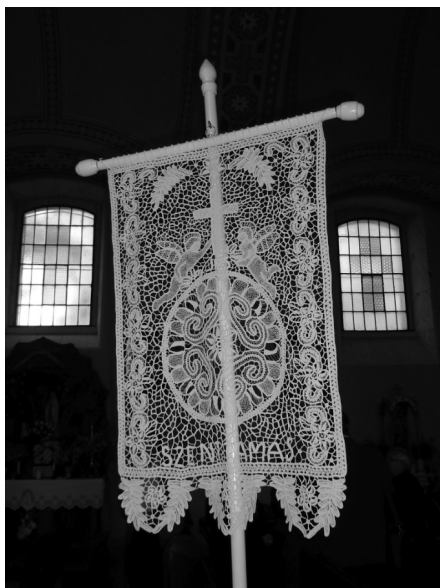
Csipkés templomi zászló a délvidéki Szenttamáson