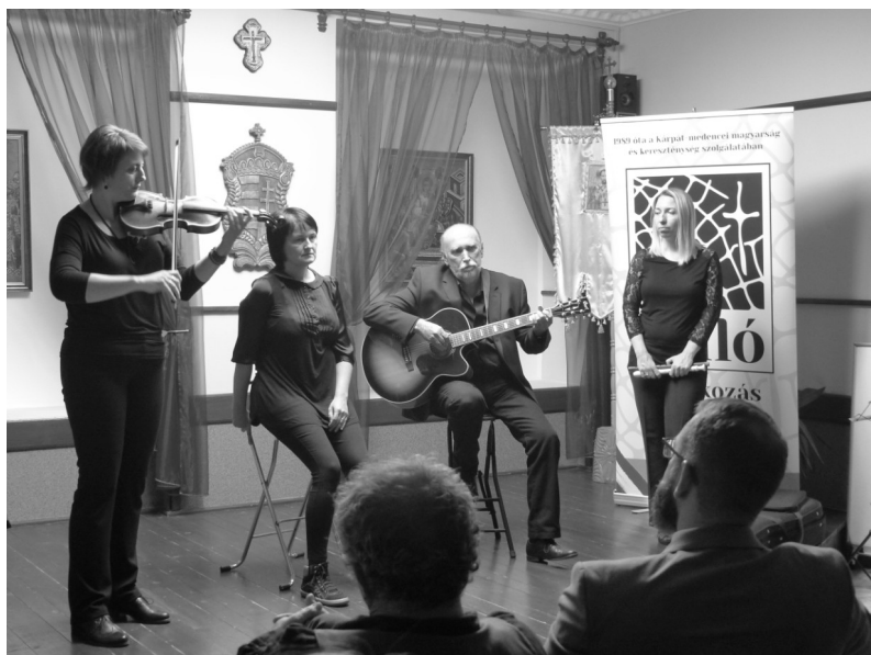
A kárpátaljai Credo együttes koncertje a Háló 2019. őszi Kárpát-medencei nagytalálkozóján Karácsván